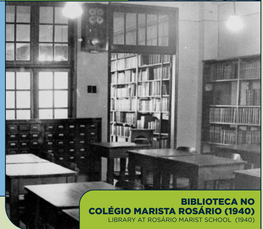
BIBLIOTECA NO COLÉGIO MARISTA ROSÁRIO (1940) LIBRARY AT ROSÁRIO MARIST SCHOOL (1940)