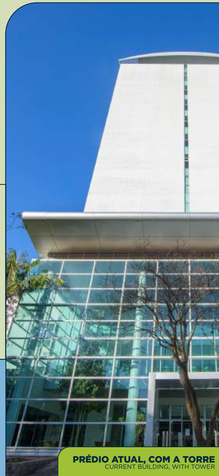
PRÉDIO ATUAL, COM A TORRE CURRENT BUILDING, WITH TOWER

Such an expansion enabled the creation of specially designed spaces for knowledge production and cultural dissemination, as well as the physical reorganization of the collection.