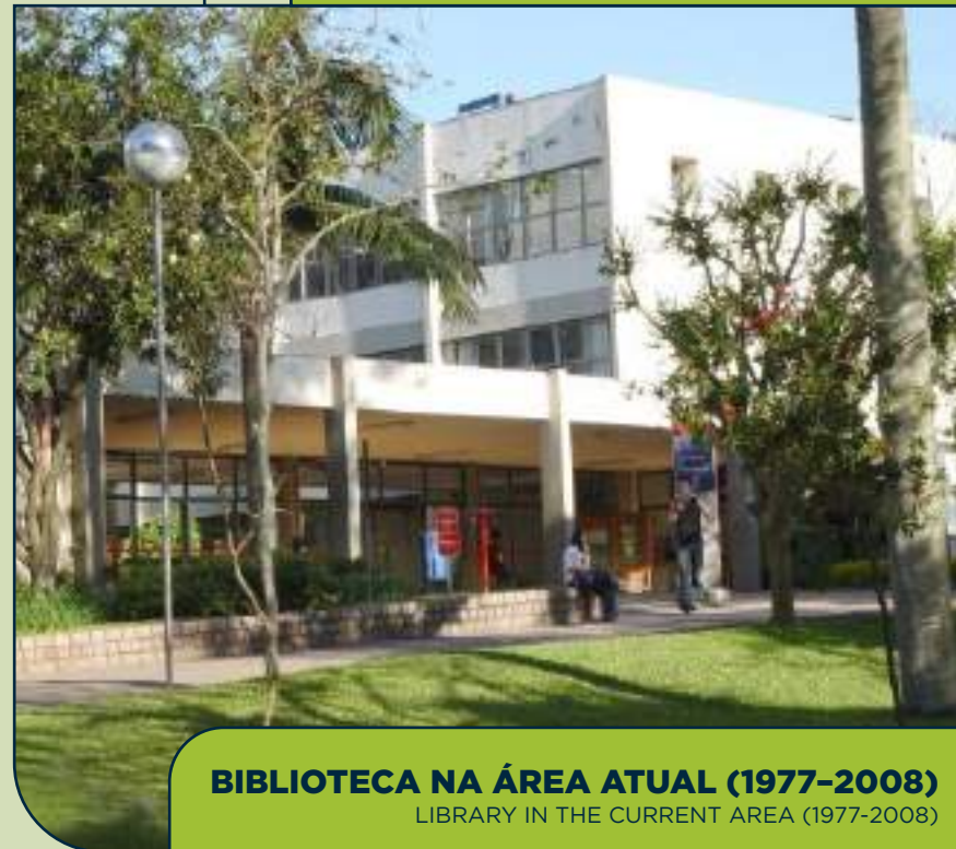
BIBLIOTECA NA ÁREA ATUAL (1977-2008) LIBRARY IN THE CURRENT AREA (1977-2008)

In 1977, it was transferred to its current location, in an area comprising 10,000 square meters.