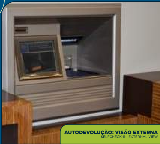
AUTODEVOLUÇÃO: VISÃO EXTERNA SELF-CHECK-IN: EXTERNAL VIEW