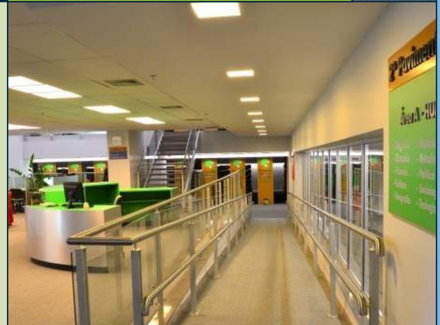
RAMPAS DE ACESSO NO 2º PAVIMENTO ACCESS RAMPS ON THE 2ND FLOOR