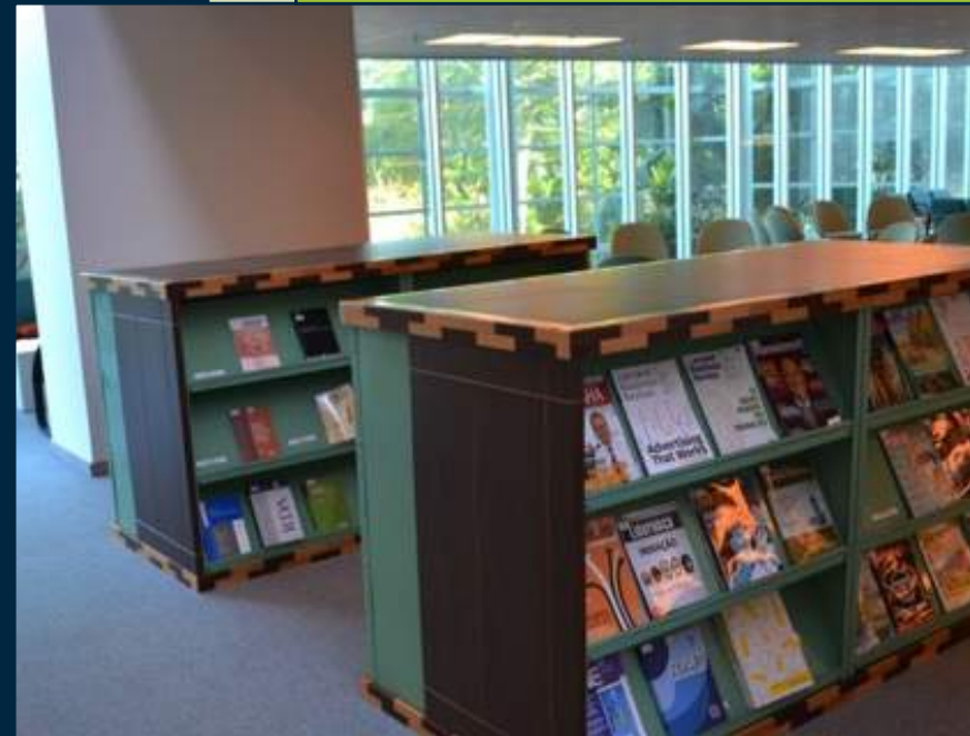
ACERVO DE PERIÓDICOS NO 2º PAVIMENTO SERIALS COLLECTION ON THE 2ND FLOOR