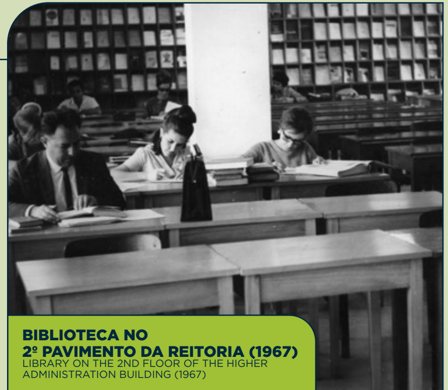
BIBLIOTECA NO 2º PAVIMENTO DA REITORIA (1967) LIBRARY ON THE 2ND FLOOR OF THE HIGHER ADMINISTRATION BUILDING (1967)

In 1967, with PUCRS' relocation to the current University Campus, the Library was moved to the second floor of the Higher Administration Building.