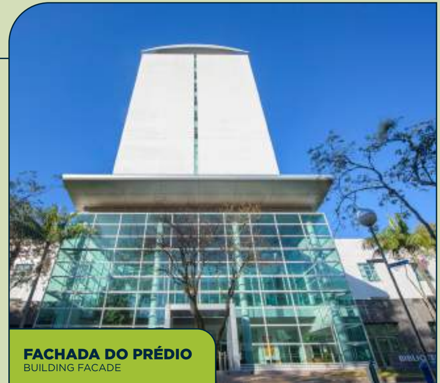
FACHADA DO PRÉDIO BUILDING FACADE

Strategically located at the core of PUCRS University Campus, the Irmão José Otão Main Library had its origins in 1940, in the collection of the Schools of Economics, Philosophy, Social Work and Law, located next to the Rosário Marist School.