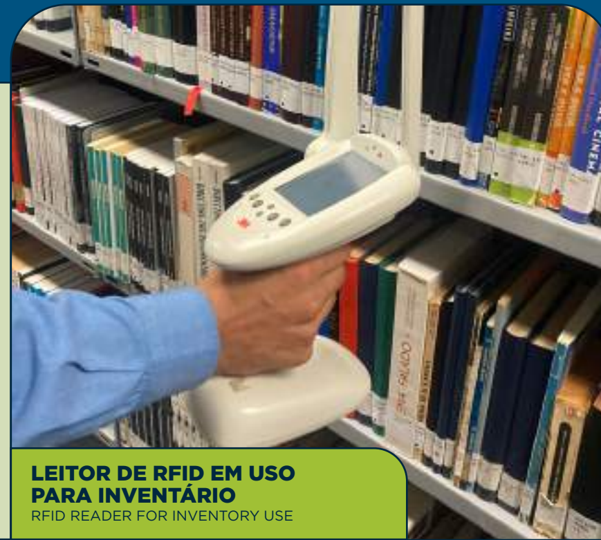
LEITOR DE RFID EM USO PARA INVENTÁRIO RFID READER FOR INVENTORY USE

Adopted for identification and tracking of different items in the collection, it facilitates collection management for inventory and shelf organization, and it makes lending and return operations more efficient.