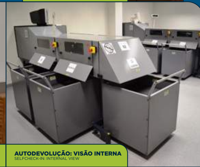
AUTODEVOLUÇÃO: VISÃO INTERNA SELF-CHECK-IN: INTERNAL VIEW