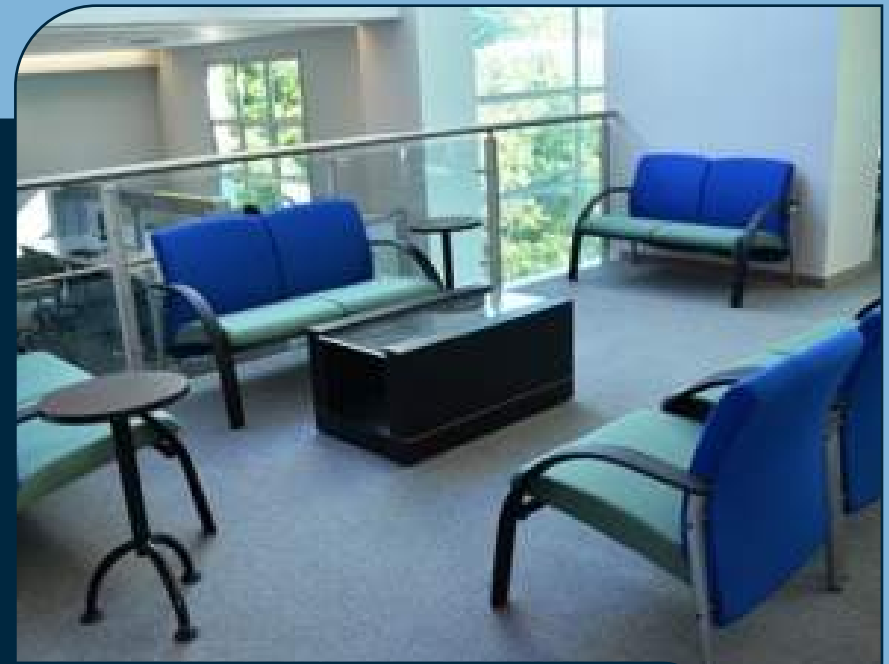
ESPAÇO DE LEITURA NO 3º PAVIMENTO READING SPACE ON THE 3RD FLOOR

Access, mobility and use of services by people with special needs are facilitated by ramps, elevators and appropriate furniture. Audiobooks, computer programs and appropriate equipment are provided to visually impaired users, in a service open to the general public.